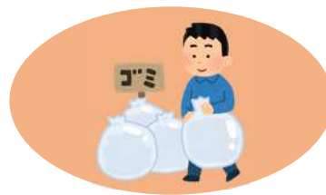
日常生活のゴミ出しなど