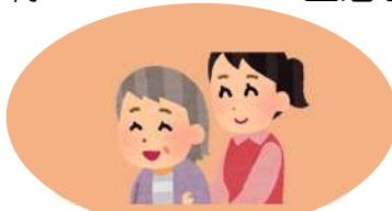
病院内の付き添い (光市内)