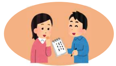
談話・朗読・見守り