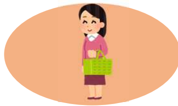
生活必需品の買い物