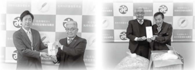
山口県東部ヤクルト販売 様 室積商店会ボランティア隊 様

●本会への寄附金は、所得税および個人住民税、法人税の控除対象になります。 ●皆さまからのご寄附は、地区社協の活動費、貸出用車両の維持費、社協だよりの発行、香典はがきの印刷などに活用させていただいています。