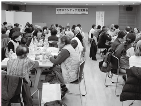
光市ボランティア交流集会

一般会費の50%と賛助・法人・団体会費の約40%は、地区社会福祉協議会の活動費として還元し、皆様に身近な地域での住民福祉活動に活用いたします。