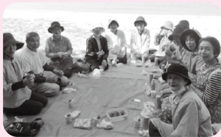
(ツインクルボウル)