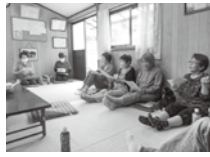
ふれあいいきいきサロン