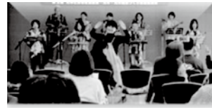
ふれあい健康フェスティバル