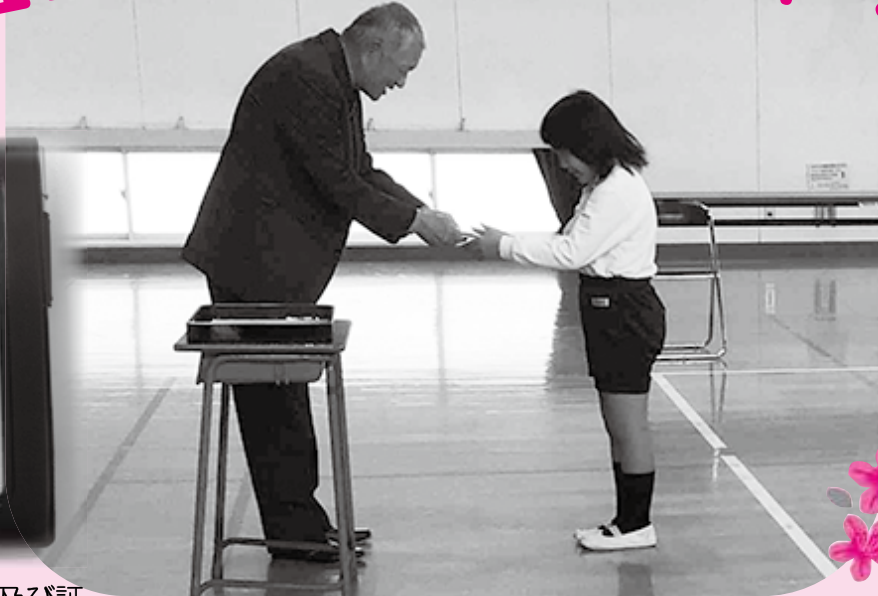
ジュニア福祉員手帳及び証

光市内の全小学校でジュニア福祉員委嘱式が行われ、子どもたちはジュニア福祉員として思いやりの気持ちを持って、様々な地域活動を行っています。