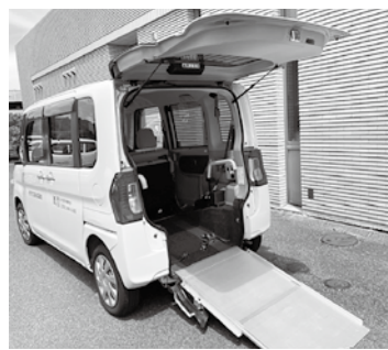
貸出に使用する車椅子積載車両の 維持・管理（光市社会福祉協議会所有）