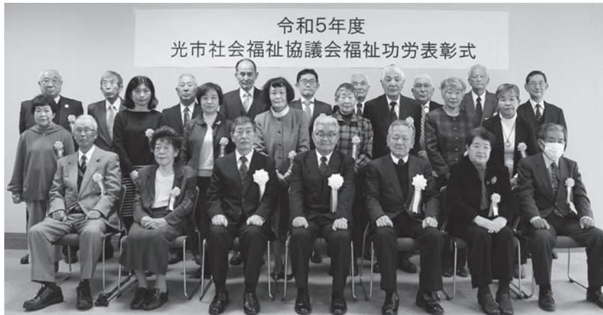
令和5年度 光市社会福祉協議会福祉功労表彰式

令和6年2月10日(土)あいぱーく光いきいきホールにて、光市社会福祉協議会福祉功労表彰式が開催されました。