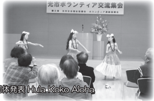
ボランティア連絡協議会登録団体発表 Hula Koko Aloha