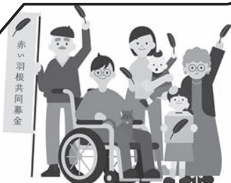
赤い羽根共同募金キャラクター 赤羽根家

募金は、光市社会福祉協議会窓口 でも受け付けています。 10/1には、市内9ヶ所で街頭募 金を行います。