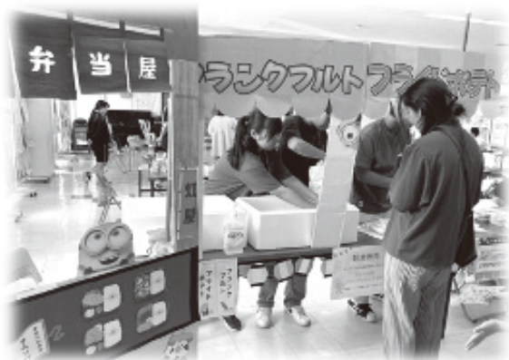
子どもたちのために (子ども会援助活動や子ども食堂に関する活動など)