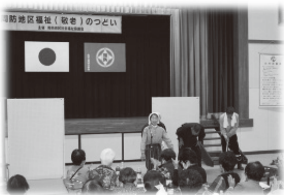
高齢者のために (敬老会や見舞い品など)

集められた募金は光市のさまざまな地域福祉活動に役立てられます。 皆様のご協力をお願いいたします。